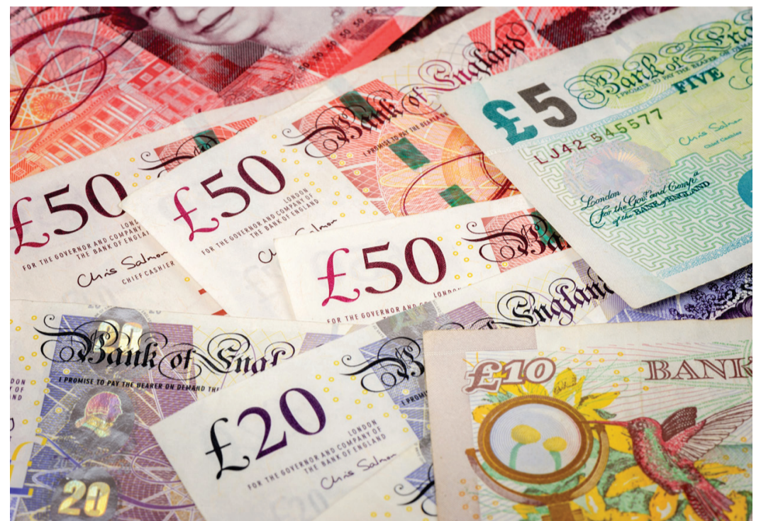
Bees and honey!

For example, if Eliza's father wanted to steal someone's wallet, he could say to his friend, 'Follow this man, he has a lot of bees and honey ' (he has a lot of money ). Or if he wanted to talk about a beautiful woman's legs without her knowing, he was able to say, 'Look at her bacon and eggs !' (look at her legs ). A phone was 'dog and bone' and 'Adam and Eve' meant 'believe'. So how about using some cockney English next time you are on the dog and bone ?